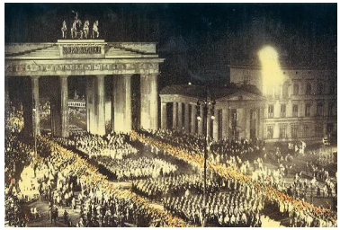
„Drittes Reich“ 1933-1945

Die Ernennung Hitlers zum Reichskanzler am 30.1.1933 wurde propagandistisch von der NSDAP selbst als „Machtergreifung“ bezeichnet.